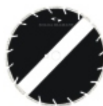
ASFALT + BETON BLZ